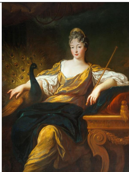
Франсуаза-Мария де Бурбон (Ф. де Труа)