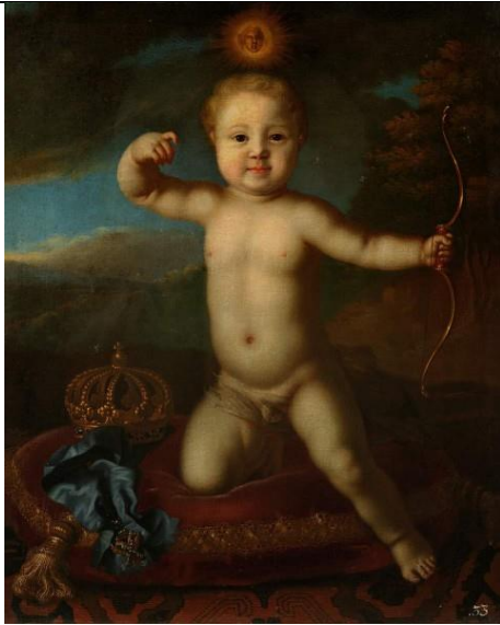
царевич Петр Петрович (Л. Каравак)