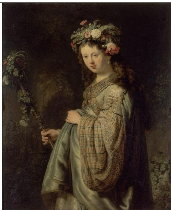
Саския, жена Рембрандта