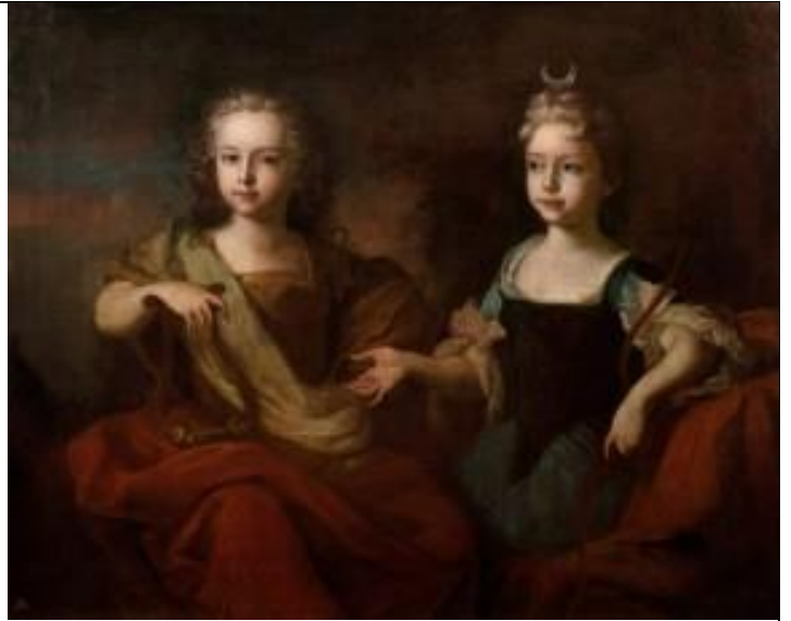
царевич Петр Алексеевич и царевна Наталья Алексеевна (Л. Каравак)