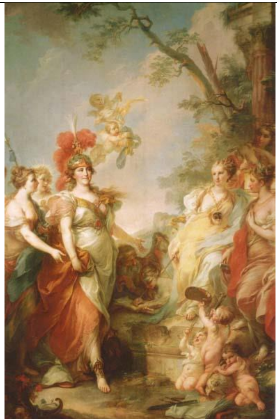
императрица Екатерина II (С. Торелли)